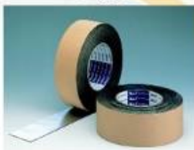
日本進口雙面防水膠帶