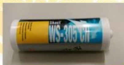
美國進口耐候防水矽力康