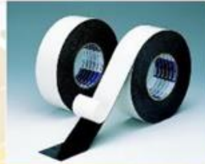
日本進口鋁箔亮面防水膠帶